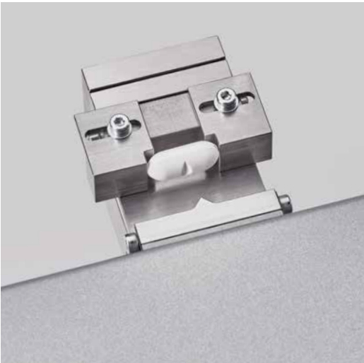
Зажимные вкладыши для испытания прочности на 3-точечный изгиб