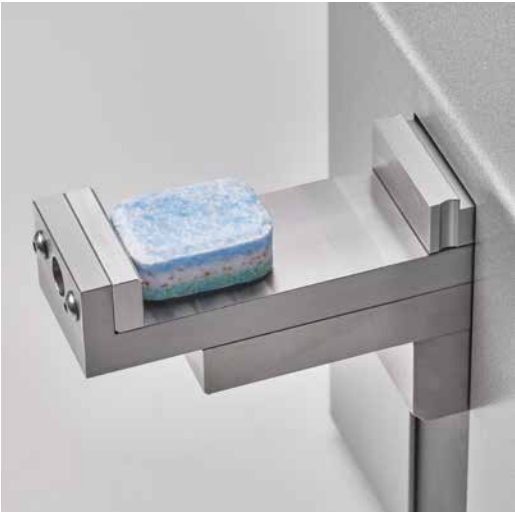
Удлиненная губка для проверки крупных форм до 65 мм