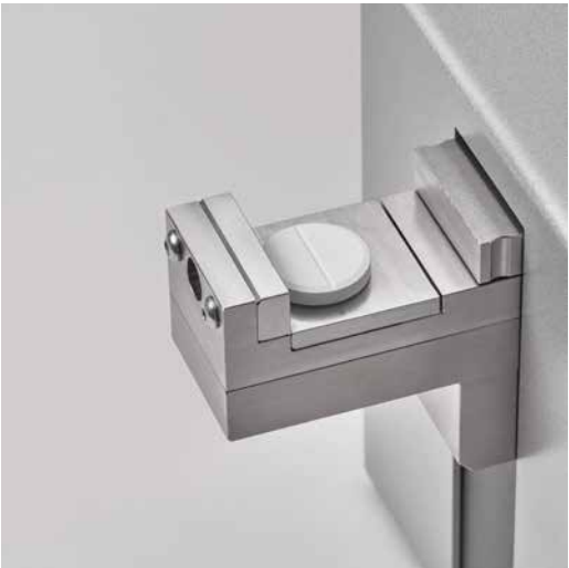
Быстросменный язычок с плоской поверхностью