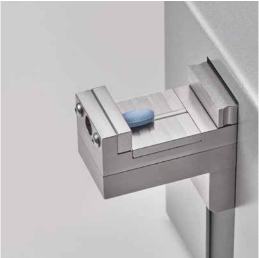
Быстросменный вкладыш с прорезью для легкого совмещения выпуклых форм

100% гибкость. Легкодоступная испытательная площадка принимает все типы, размеры и материалы. Оптимизированные движения губок обеспечивают короткое время цикла, а быстросменные вкладыши позволяют оператору легко обращаться с таблетками. Зажимные губки дополнительно расширяют возможности тестирования MT50 для испытаний на прочность при трехточечном изгибе или других методов испытаний.